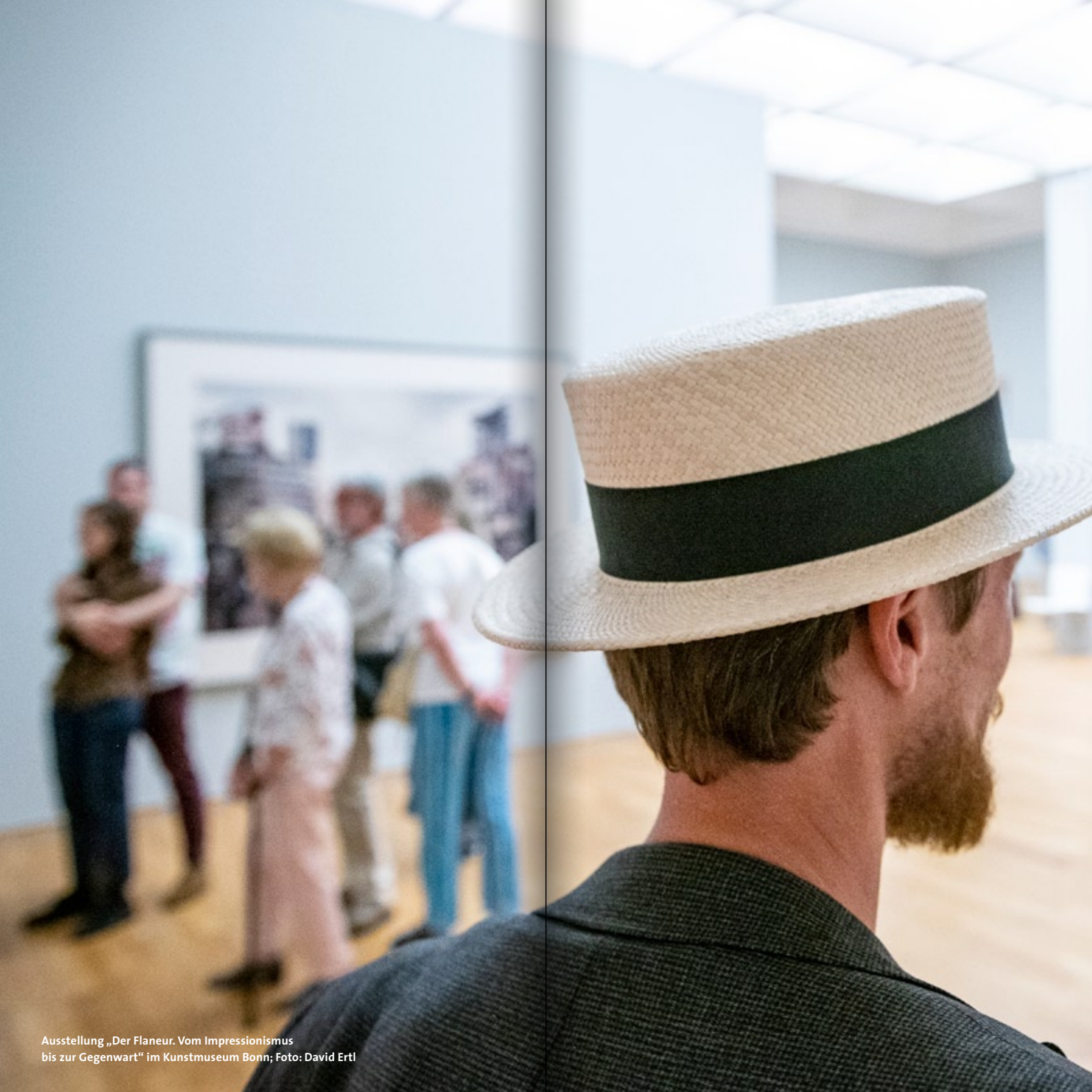
Ausstellung „Der Flaneur. Vom Impressionismus bis zur Gegenwart“ im Kunstmuseum Bonn; Foto: David Ertl